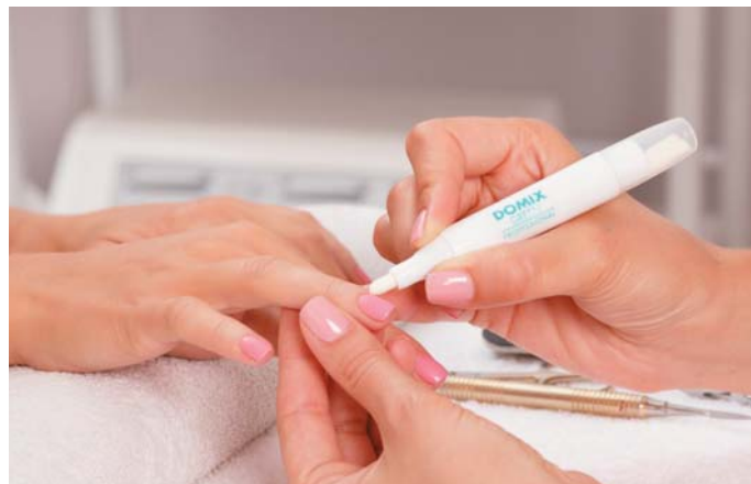
Корректор маникюра 5 мл