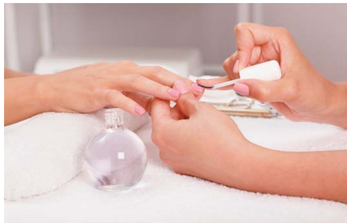
Верхнее покрытие 75 мл