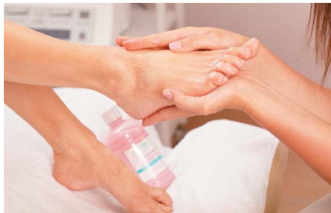
Гель-скраб для SPA процедур 500 мл