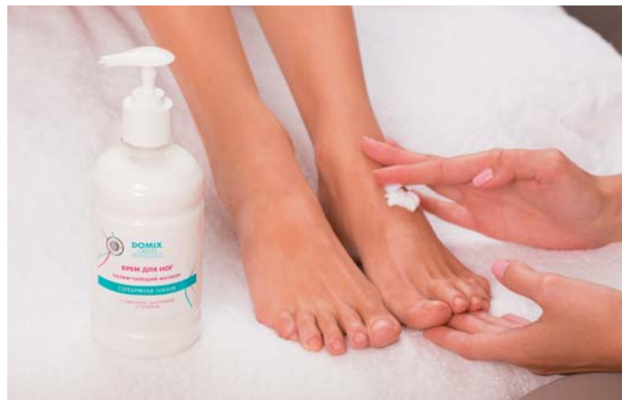
Крем для ног размягчающий мозоли с наносеребром 500 мл