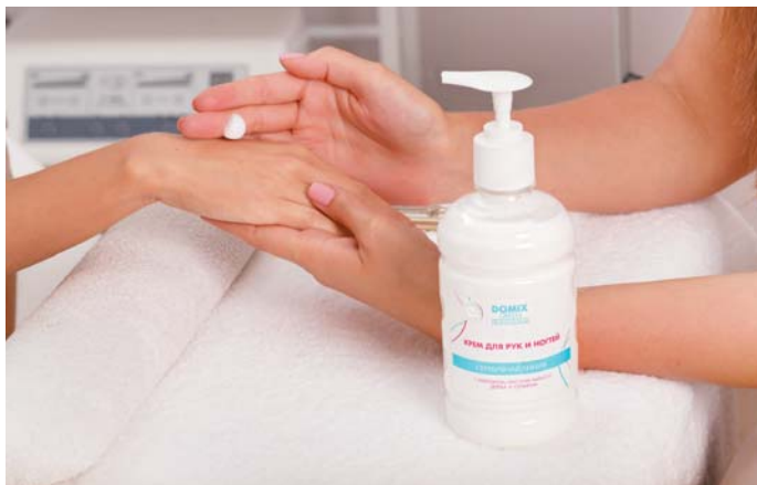
Крем для рук и ногтей с кератином, маслом чайного дерева и наносеребром 500 мл