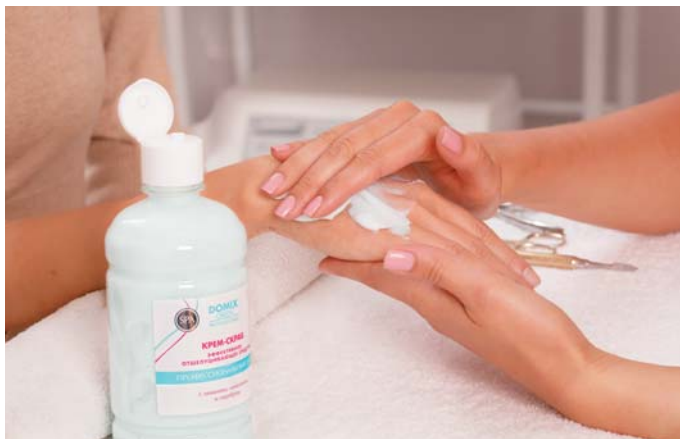
Крем-скраб с наносеребром 500 мл