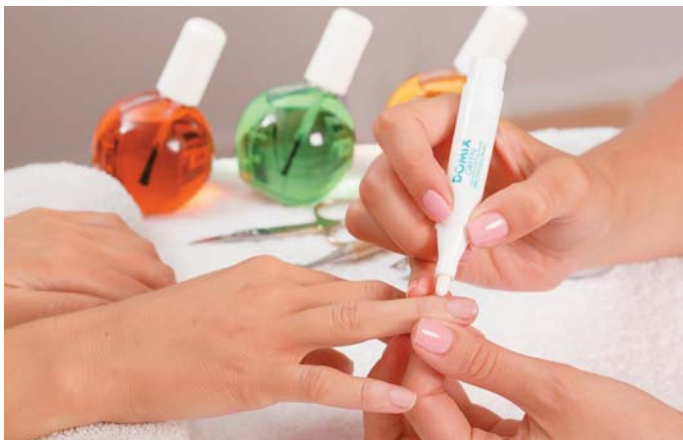
Масло для кутикулы 5 мл